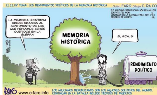
Ilustración 1. poder de la memoria | Memoria, Historia de España, Tema

VAMOS AVANZANDO Y PROFUNDIZANDO EN EL TEMA DE LA MEMORIA HISTORICA.